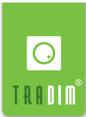
Afbeelding A Figure A Abbildung A